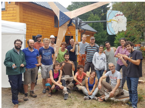
Fabrication et installation d'éolienne

Quelques exemples d'actions menées par l'association :