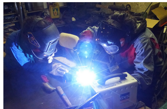
Initiations à la soudure à l'arc