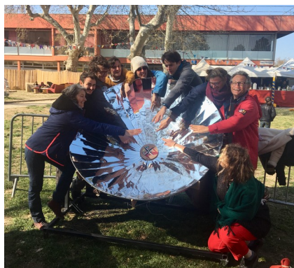
Cuiseur solaire parabolique